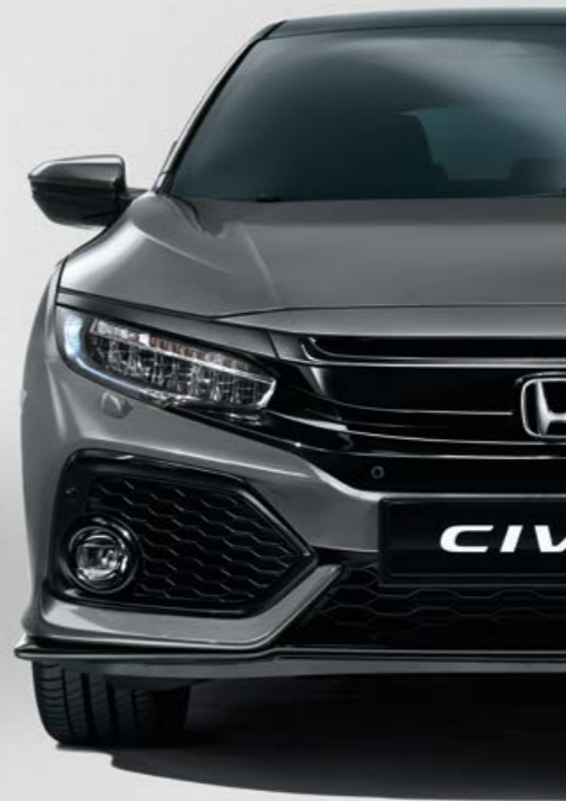
POLISHED METAL METALLIC