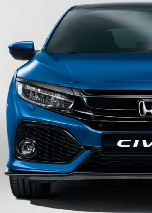
BRILLIANT SPORTY BLUE METALLIC