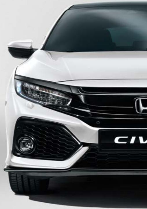
WHITE ORCHID PEARL